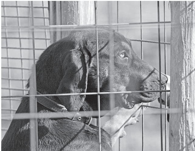
Lietuvių skalikai – draugiški šunys.

Kučinskienė (Veterinarijos akademija) skaitė pranešimą „Porų parinkimas atsižvelgiant į giminingumą – būtinybė, siekiant užtikrinti lietuvių skalikų veislės stabilumą ir sveiką genofondą“. Ji pabrėžė, kad dabartinė lietuvių skalikų veislė išvesta poruojant giminingus individus. Aukštas giminingumo koeficientas lemia tai, kad pasitaiko genetiškai paveldimų ligų bei kitokių sveikatos sutrikimų. Nors lietuvių skalikai (kaip ir žemaitukai) serga retai,